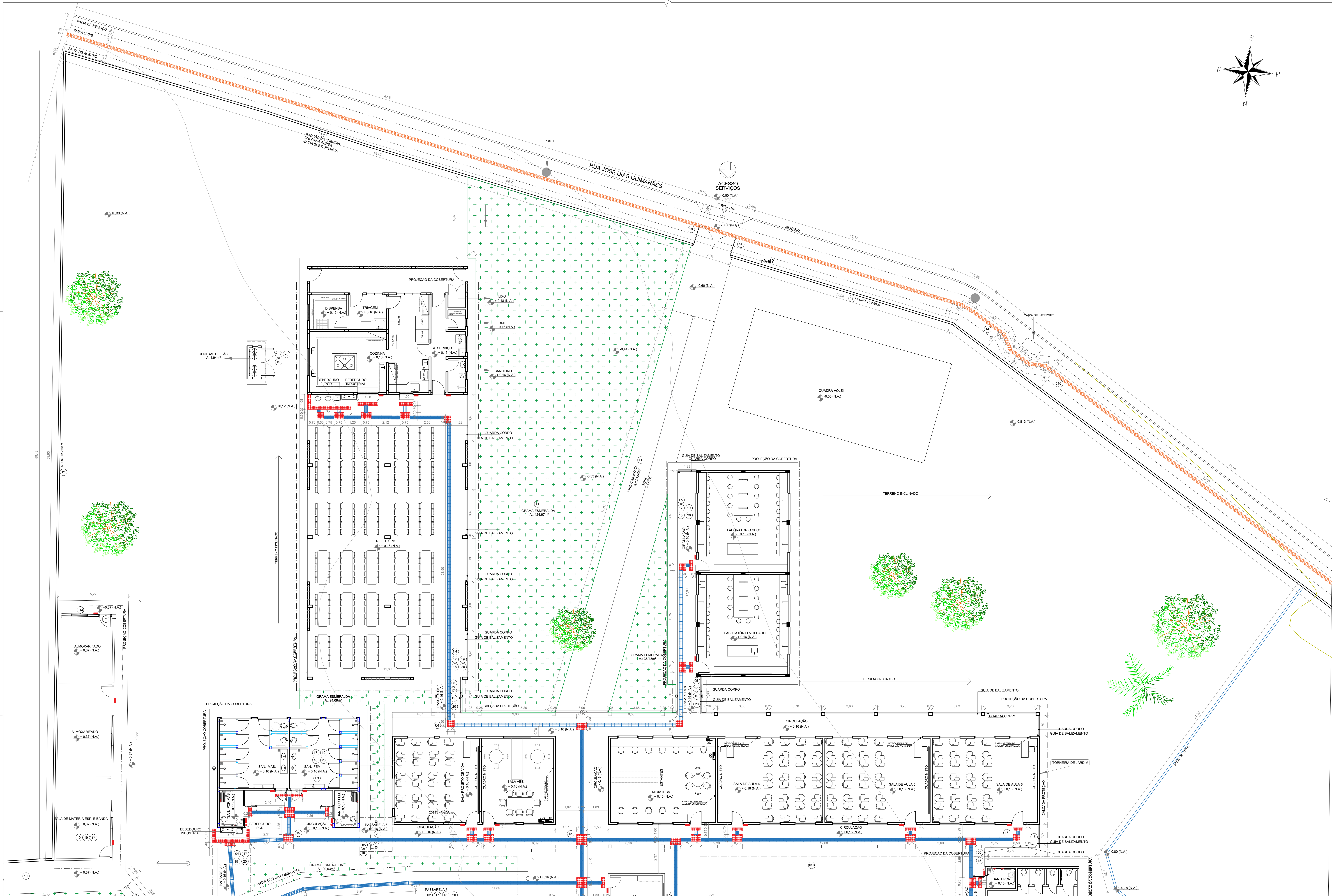
PLANTA LAYOUT / ACESSIBILIDADE PARTE 01 ESCALA: 1:100